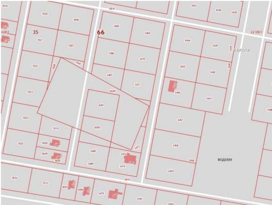
Угловой участок на стыке с поселком Европа 2 и лесным массивом (66:35:0221001:482)